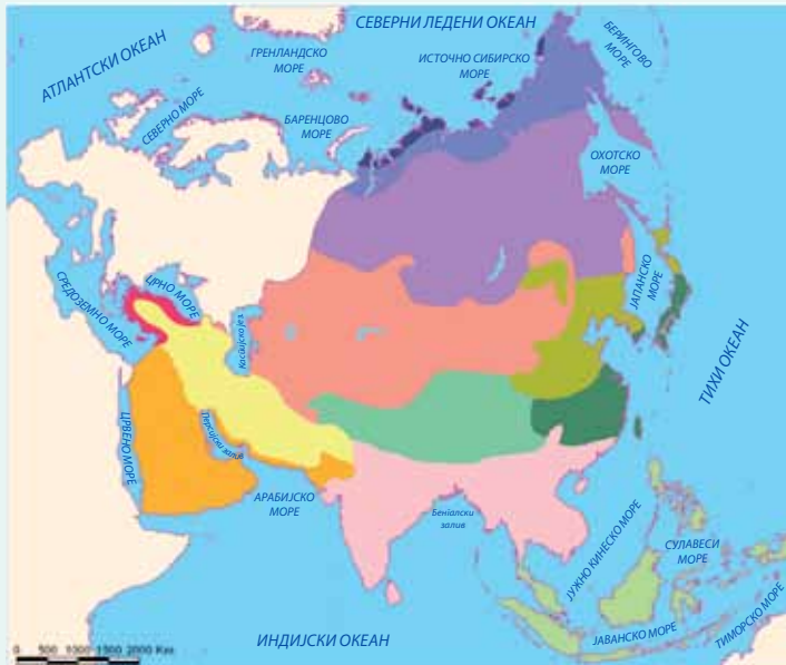
Климатски типови Азије