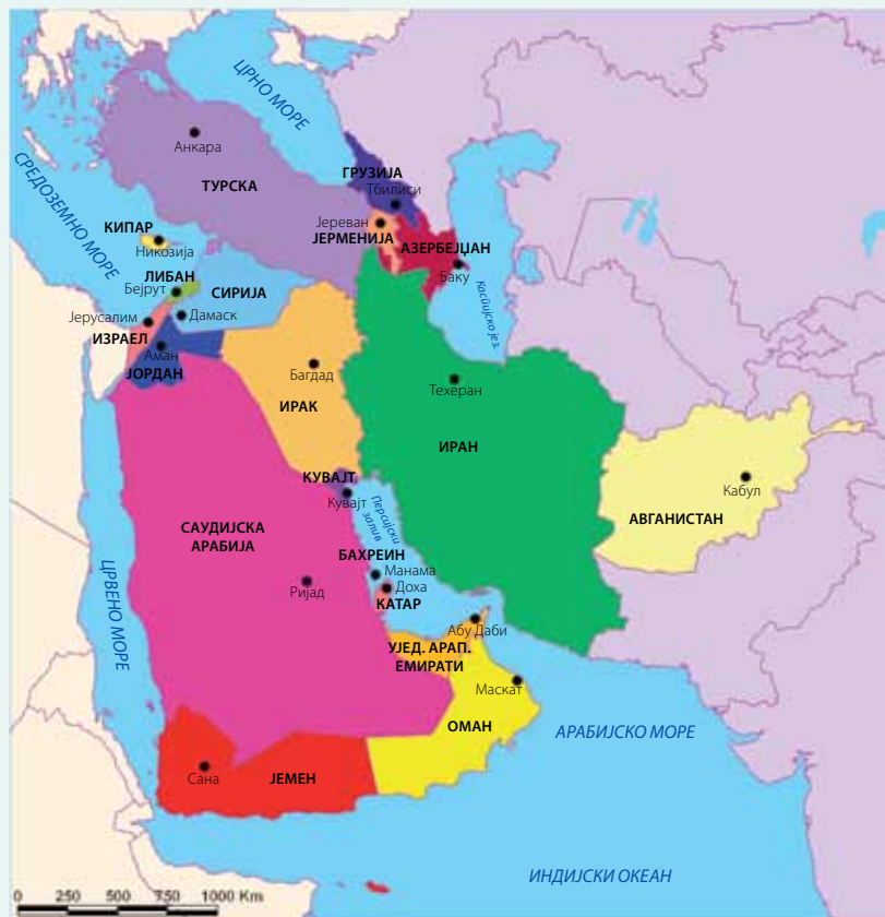
Политичка карта Југозападне Азије

Домаћи задатак: одговорити на питања из радне свеске са стр. 24–25.