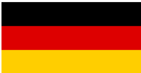
3. Застава Немачке