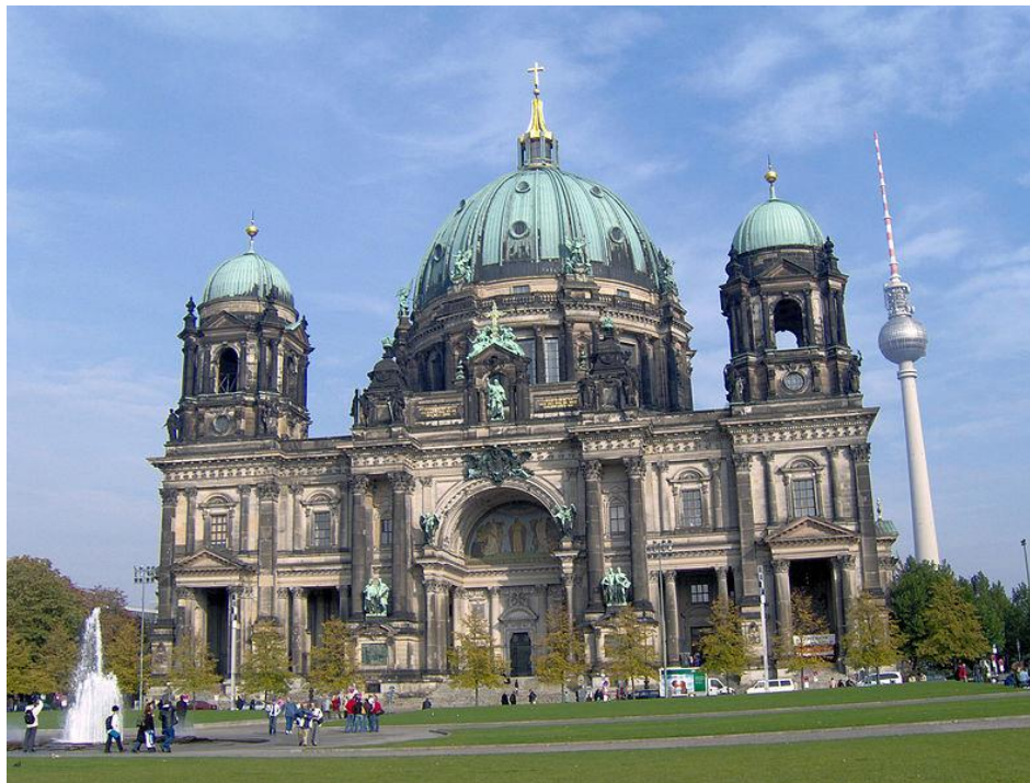
1. Берлинска катедрала

Фотографије и апликације коришћене на 1. часу