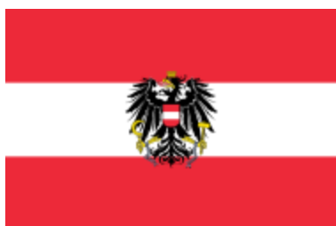
7. Застава Аустрије